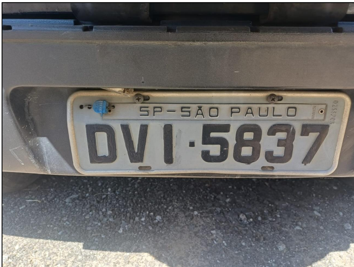
ITEM 001 - FORD ECOSPORT XLS 1.6 FLEX ANO: 2006/2007 PLACA DVI5837