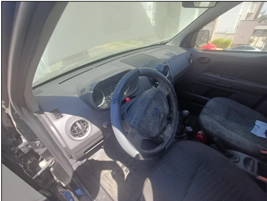
ITEM 001 - FORD ECOSPORT XLS 1.6 FLEX ANO: 2006/2007 PLACA DVI5837