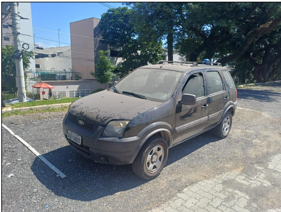
ITEM 001 - FORD ECOSPORT XLS 1.6 FLEX ANO: 2006/2007 PLACA DVI5837