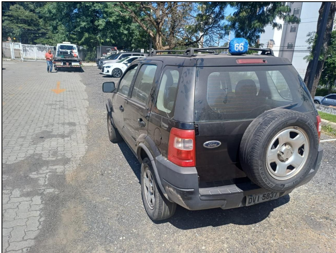
ITEM 001 - FORD ECOSPORT XLS 1.6 FLEX ANO: 2006/2007 PLACA DVI5837