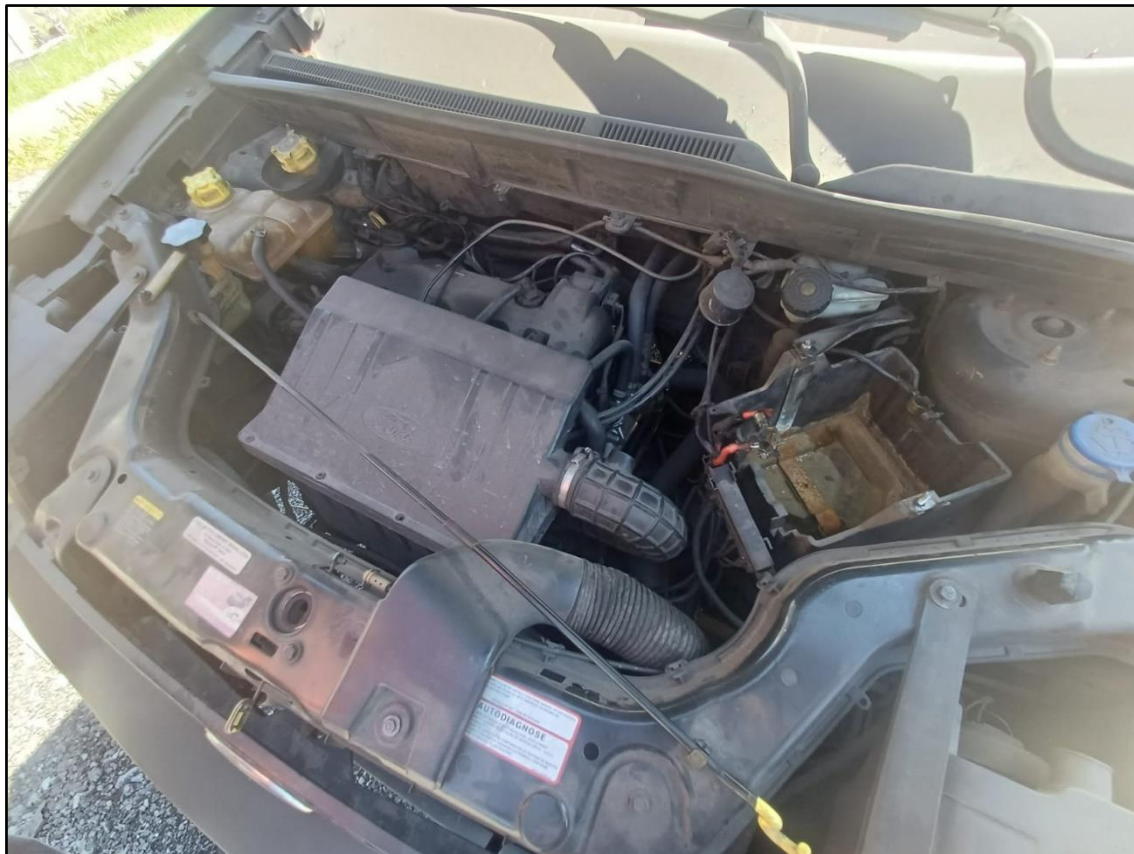
ITEM 001 - FORD ECOSPORT XLS 1.6 FLEX ANO: 2006/2007 PLACA DVI5837