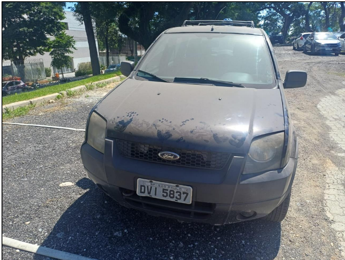
ITEM 001 - FORD ECOSPORT XLS 1.6 FLEX ANO: 2006/2007 PLACA DVI5837