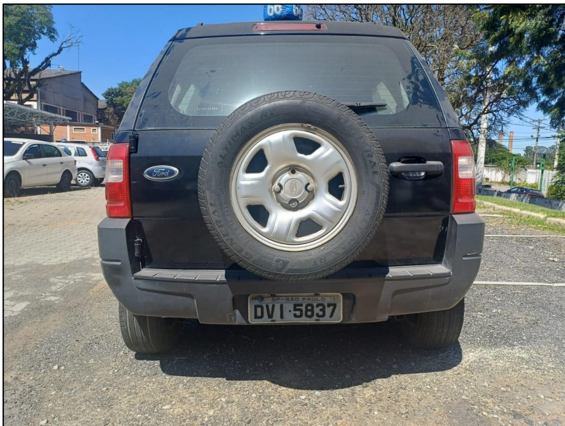
ITEM 001 - FORD ECOSPORT XLS 1.6 FLEX ANO: 2006/2007 PLACA DVI5837