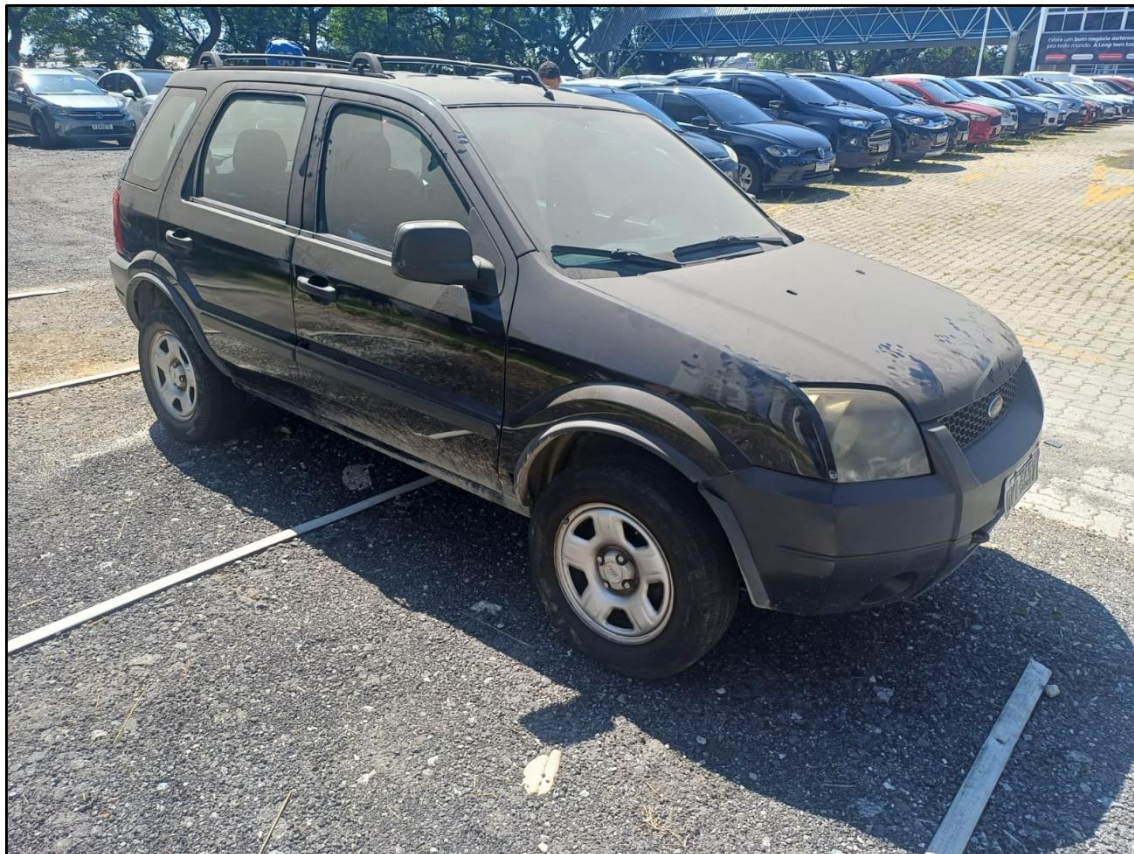
ITEM 001 - FORD ECOSPORT XLS 1.6 FLEX ANO: 2006/2007 PLACA DVI5837