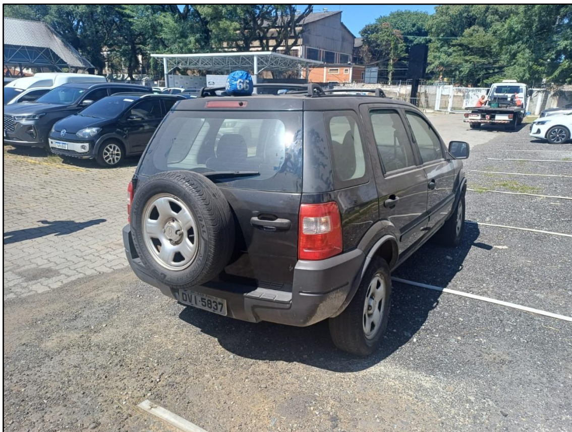
ITEM 001 - FORD ECOSPORT XLS 1.6 FLEX ANO: 2006/2007 PLACA DVI5837